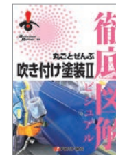
徹底図解 丸ごとぜんぶ 吹き付け塗装II