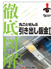
徹底図解 丸ごとぜんぶ 引き出し钣金II