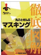
徹底図解 丸ごとぜんぶ マスキング