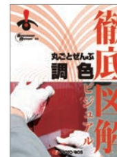
徹底図解 丸ごとぜんぶ 調色