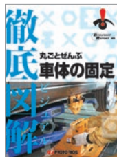
徹底図解 丸ごとぜんぶ 車体の固定